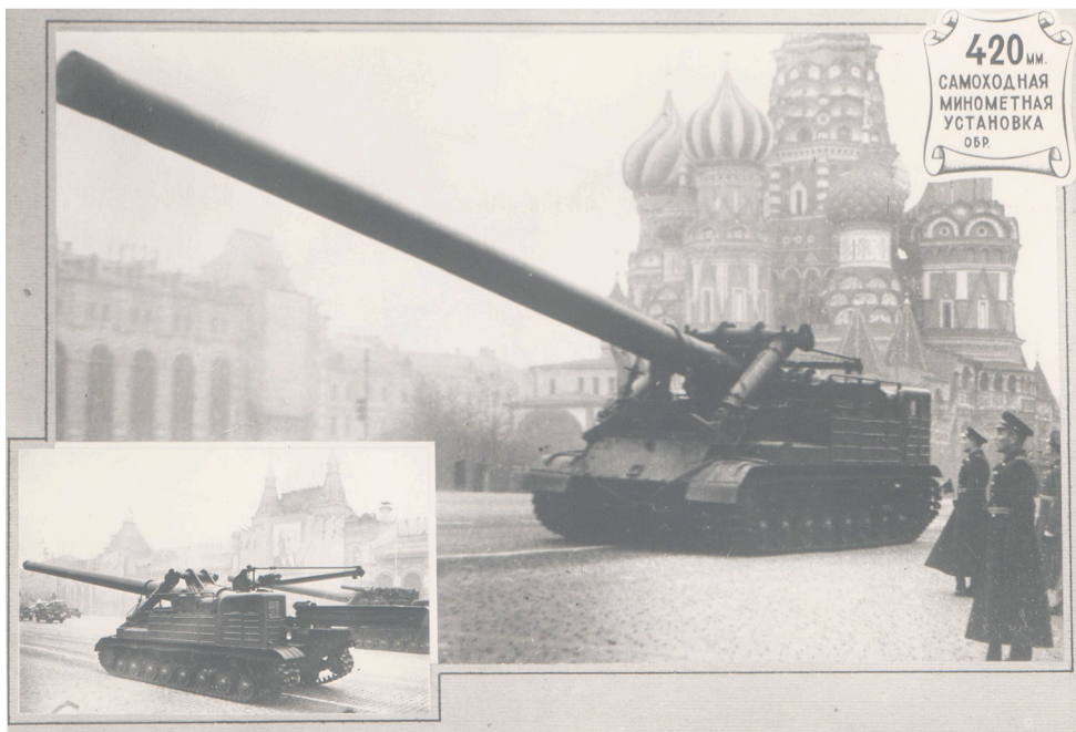
Самоходная миномётная установка калибра 420 мм