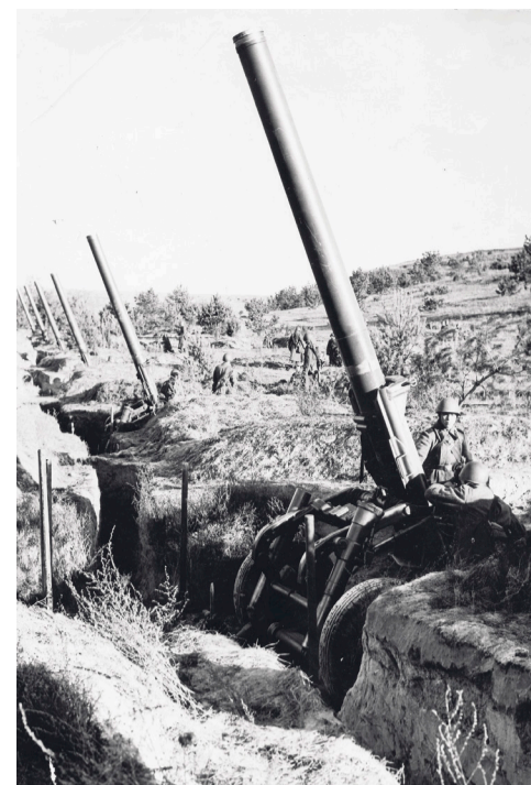
Миномёт калибра 240 мм на позициях